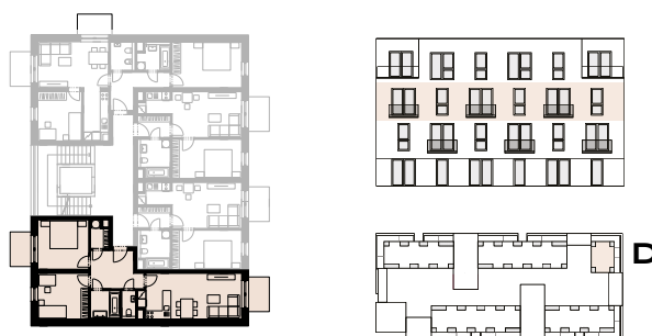
Schéma půdorysu představuje dispoziční řešení bytu. Zobrazené vybavení nábytkem, vestavěné skříně, kuchyňská linka včetně spotřebičů a pračky nejsou součástí dodávky bytu. Toto vybavení je zobrazeno pouze pro názornost. Celková podlahová plocha je vypočtena dle nařízení vlády č. 366/2013 Sb. Veškeré informace, jakoliv publikované v tomto dokumentu jsou nezávazné marketingové informace obecné povahy, které nelze vykládat jako nabídku na uzavření smlouvy ani se jich nelze dovolávat.